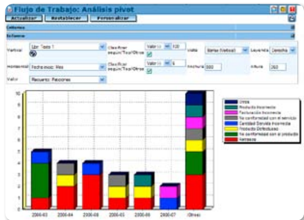
Análisis no conformidades.