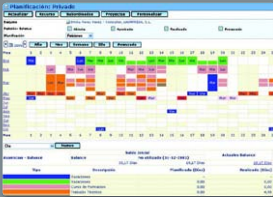
Planificación del comercial: acceso y conocimiento en tiempo real a toda su actividad