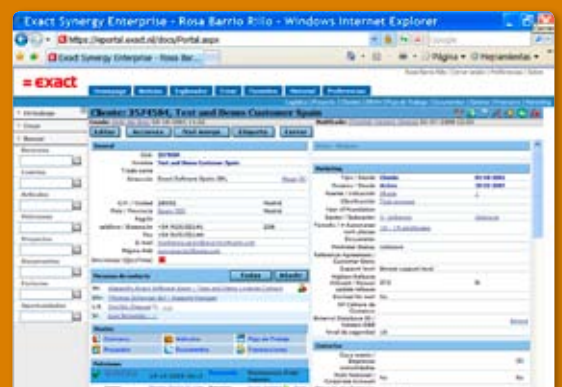
Desde la ficha del cliente se accede a toda la información referente al mismo